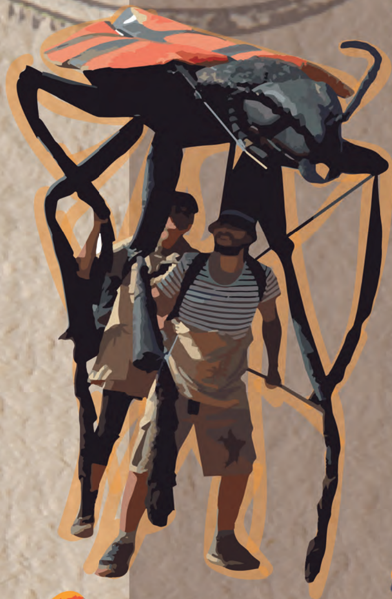
Astylus Trifaciatus (Pololo Común)