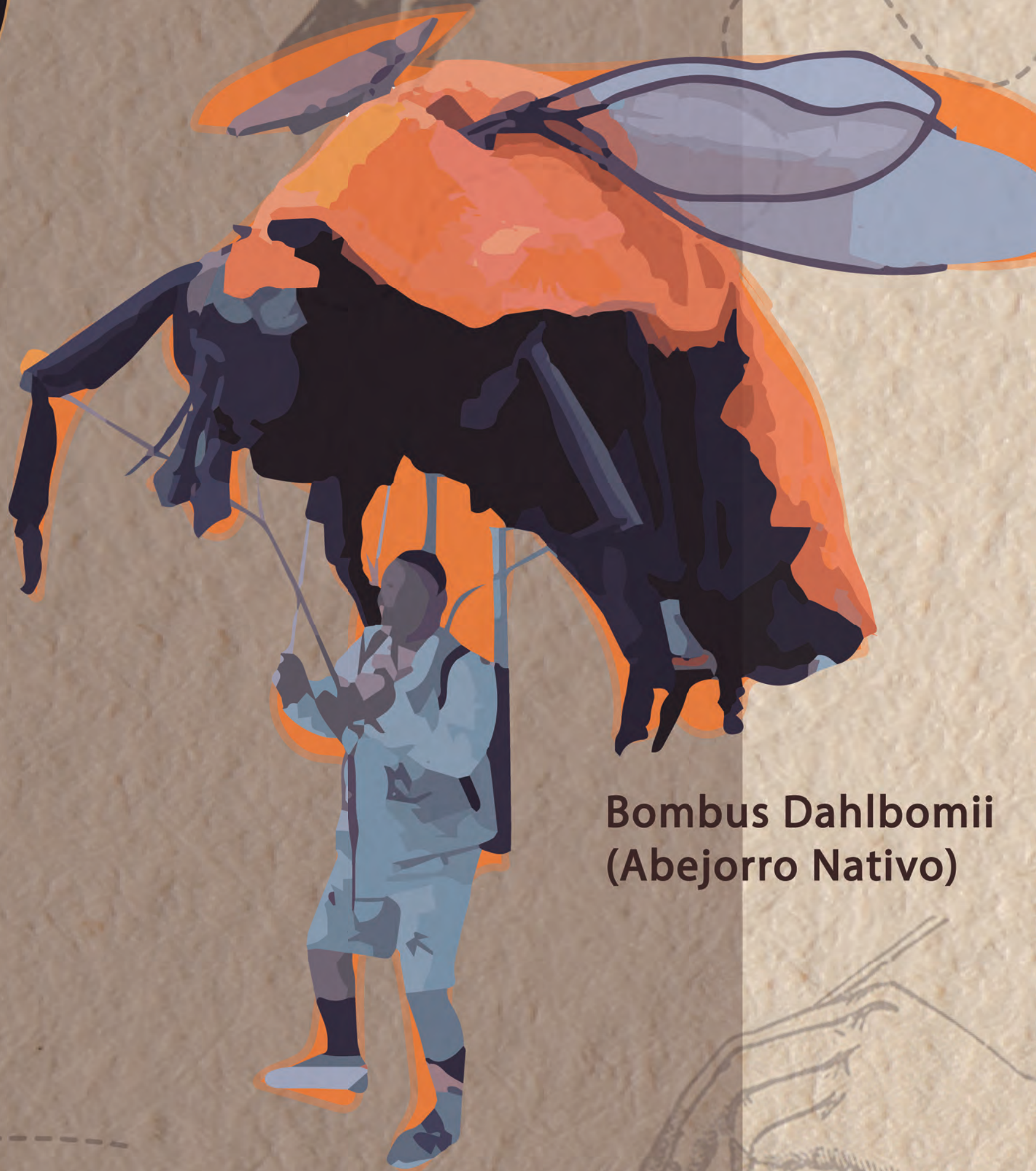
Bombus Dahlbomii (Abejorro Nativo)

Éstas creaciones obtuvieron financiamiento del FONDO DE ARTES ESCÉNICAS convocatoria 2021 y 2022